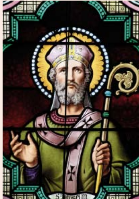
Anselm von Canterbury (1033-1109).

IN SEINEM BUCH »CUR DEUS HOMO« (Warum Gott Mensch wurde) versucht Anselm zu beweisen, dass Gott Mensch werden musste, um die durch die Erbsünde gefallene Menschheit mit Gott wieder zu versöhnen. Die Beweisführung erfolgt in der Form eines Dialogs, den der Autor Anselm mit dem möglicherweise fiktionalen Mönch Boso führt. Anselm fragt: Warum hat Gott Menschengestalt angenommen und ist am Kreuz gestorben? Hätte es nicht auch einen bequemeren, sanfteren, eleganteren Weg gegeben, die